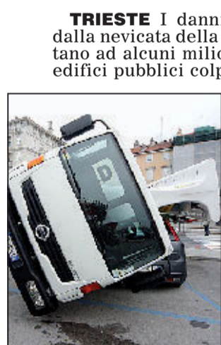
Danni della bora

TRIESTE I danni provocati dalla bora e dalla nevicata della scorsa settimana ammontano ad alcuni milioni di euro. La lista degli edifici pubblici colpiti è impressionante. Solo per quelli comunali si parla di danni per oltre 500 mila euro. Ci sono il museo Revoltella, l'Aquario marino, il castello di San Giusto, l'Orto botanico e anche la biblioteca. Infine - sempre per quanto riguarda le strutture pubbliche - danni sono stati segnalati al campo sportivo di Cologna. Senza contare i danni ai privati. Chi paga? Fino a ieri risultavano solo a Trieste non meno di 500 richieste di risarcimento danni alle assicurazioni da parte dei titolari di polizze, privati proprietari di appartamenti, automobili o strutture artigianali.