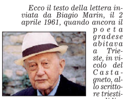
gna slovena Boris Pahor. La missiva proviene dal suo archivio privato.

Illustre Dottore, è Pasqua oggi, per i cristiani Pasqua di resurrezione. Per gli uomini, al di qua della qualifica religiosa, c'è sempre la possibilità della gloriosa resurrezione dell'anima. Ieri sera ho letto i Suoi appunti sulla rivista "Trieste". Certo il miglior apporto al dialogo tra noi. E Le scrivo per dirLe che mi ha fatto festa, che costituisce la mia Pasqua. Le scrivo per dirLe che desidero conoscerLa personalmente.